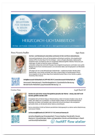
1/3 Seite Quer: 168 x 74 mm 150.-