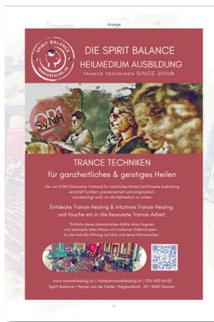
3/3 Seite Satzspiegel innen 168 x 246 mm Fr. 400.-