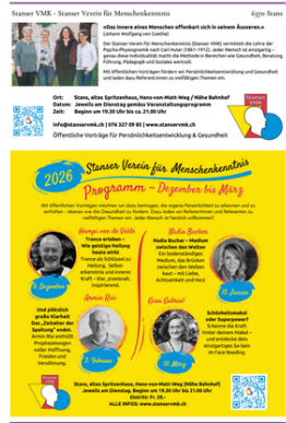
2/3 Seite Quer: 168 x 161 mm Fr. 300.-