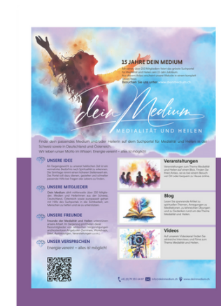
1/1 Seite Umschlag 210 x 29.7 Plus 3 mm Beschnitt Fr. 750.-